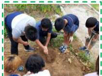
(봉사 활동 영상)