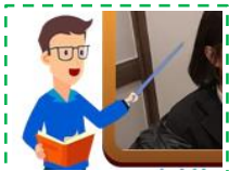
(수업 중계/녹화 영상)